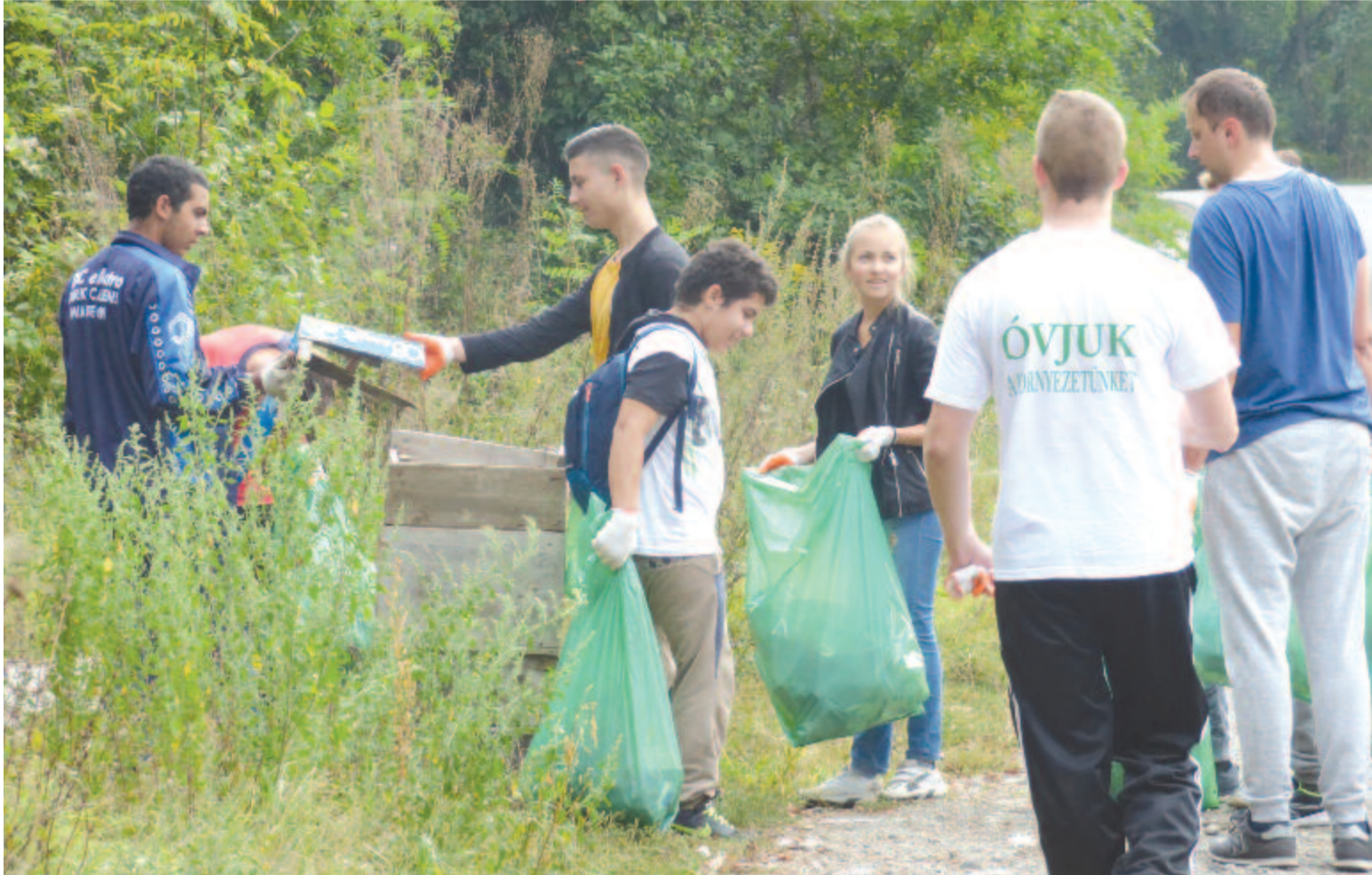
Három óra alatt is jelentős mennyiségű szemet gyűlt a nyomái erdőben