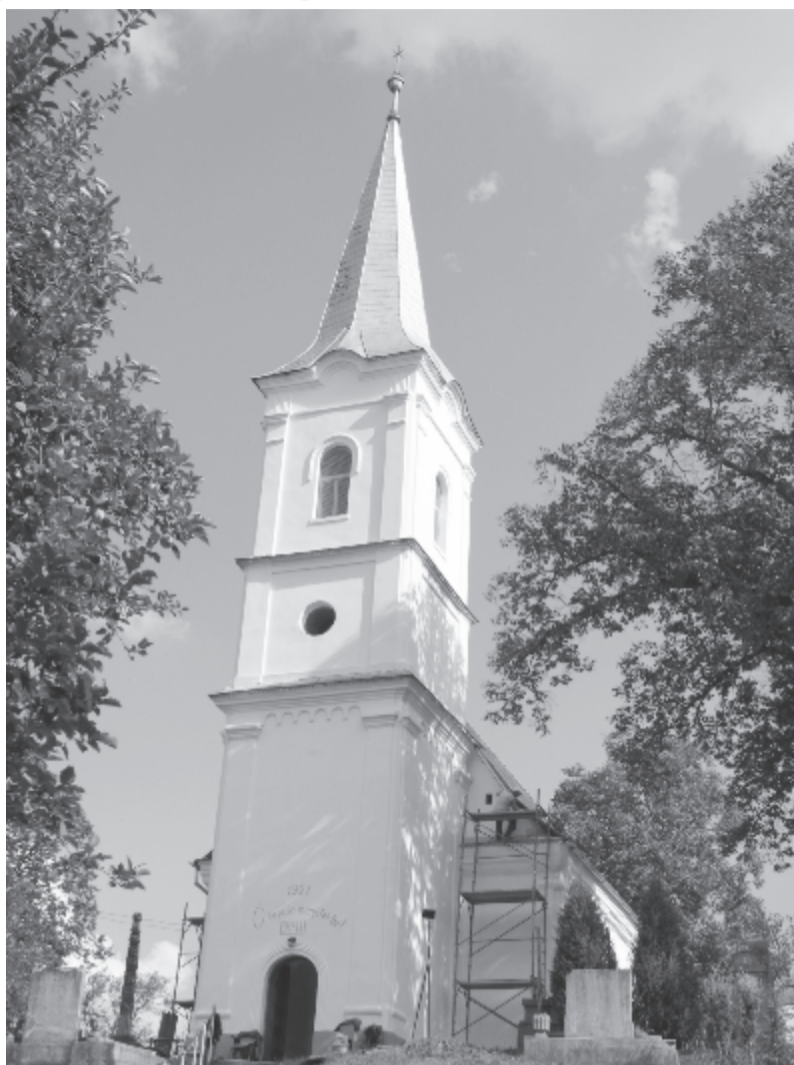
Idén befejezik a szentgericei templom felújítását

Minden évben – augusztus végén, szeptember elején – gyülekezeti napot tartanak a szentgericei reformátusok. Idén szeptember 9-én került sor erre az eseményre, az ün-